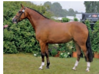
Walonca v. Cassiano - Orleandro wurde Ib-Stute im VII. Ring und bestach durch einen gewaltigen Typ und großen Trabaktionen.