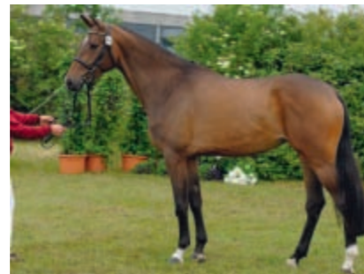
Wat ne Deern v. Farouche - Loutano wurde Ib-Stute im VI. Ring und sorgt damit für eine Wiederbelebung der alten F-Linie.