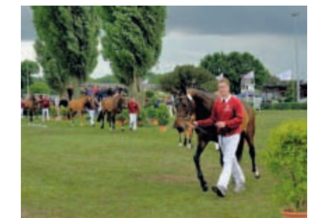
Unter den 17 Endringstuten wurden die Sieger auf dem Hauptplatz ausgewählt.

Wir müssen uns die berechnete Frage stellen: „Wo sind die Qualitätstöchter unserer Spitzenhengste Contender, Casini I oder Caretino?“ Diese Hengste decken große Stutenzahlen, insbesondere in den Qualitätskörbezirken wie z.B. Dithmarschen und Nordfriesland. Am Ende ist die „Ausbeute“ für unsere