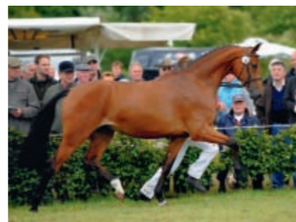
Besonders konnte die Sportlichkeit der Siegerstute gefallen. Mit großer Übersetzung überzeugte Wien v. Casiro I – Sandro – Cor de la Bryère bei jeder Vorstellung.

dem Jahrgang auch einmal zu behalten und der Verlockung des Marktes zu widerstehen. Keine einfache, aber für uns alle eine notwendige Entscheidung!