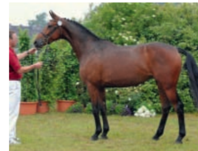
Warenga BB v. Canto - Capitol I wurde Ia-Stute im II. Ring und imponierte als gewaltiger Leistungstyp mit großer Sportlichkeit.