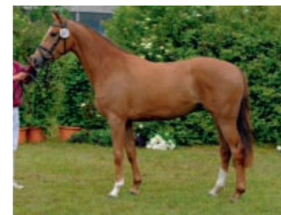
Wiance I v. Cascavello - Newton wurde Ia-Stute im VI. Ring und überzeugte durch große Korrektheit und drei hervorragenden Grundgangarten.