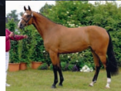
Verona I v. Casiro I - Contender wurde Ia-Stute im I. Ring und bewies die große Erbsicherheit des Stutenstammes 318D2.