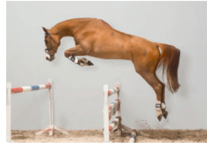
Das Spitzenpferd Argentina offenbarte ihre Klasse bereits mit dem Foto im Auktionskatalog.